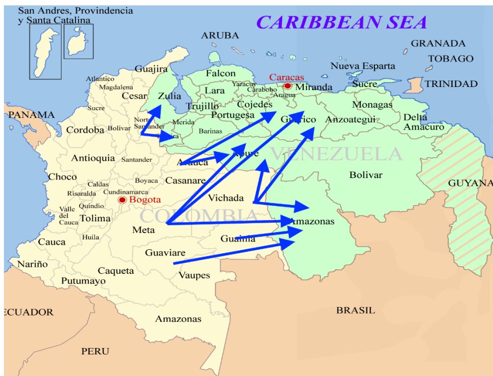
Figura 1. Rutas del narcotráfico de Colombia a Venezuela